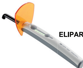
ELIPAR DEEP CURE - L