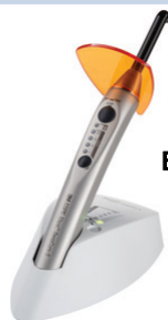
ELIPAR DEEP CURE - S